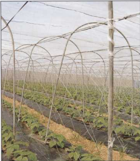
インゲンアーチパイプ パイプ規格 19.1φ