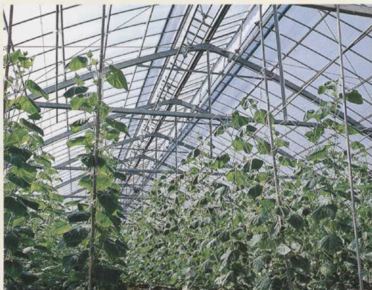
▲豊見城村 のは野菜団地（ドームタイプ）