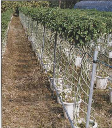
各種支柱パイプ (花卉・果樹・野菜栽培用) パイプ規格 19.1φ 22.2φ 25.4φ 38.1φ