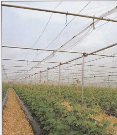
平ばりハウス (インゲン、ゴーヤー、果樹栽培用) パイプ規格 48.6φ