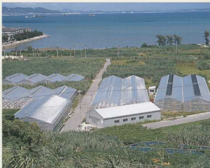
▲佐敷町 新里野菜生産組合（切妻タイプ）