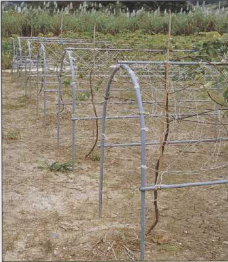
トンネルアーチパイプ (台風対策用) パイプ規格 12.7φ 19.1φ