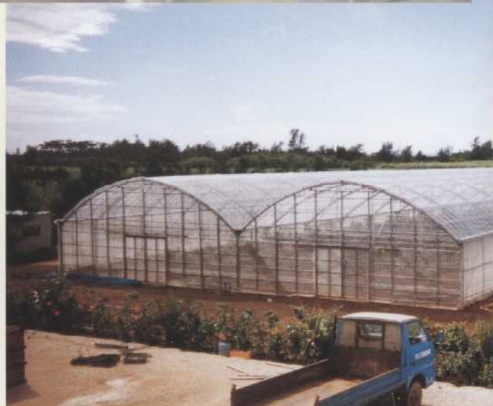
▲伊良部町 ミキ マンゴ生産組合（ドームタイプ）