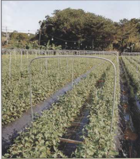
U字パイプ (キク栽培用) パイプ規格 12.7φ (5目用) 19.1φ (6目用)